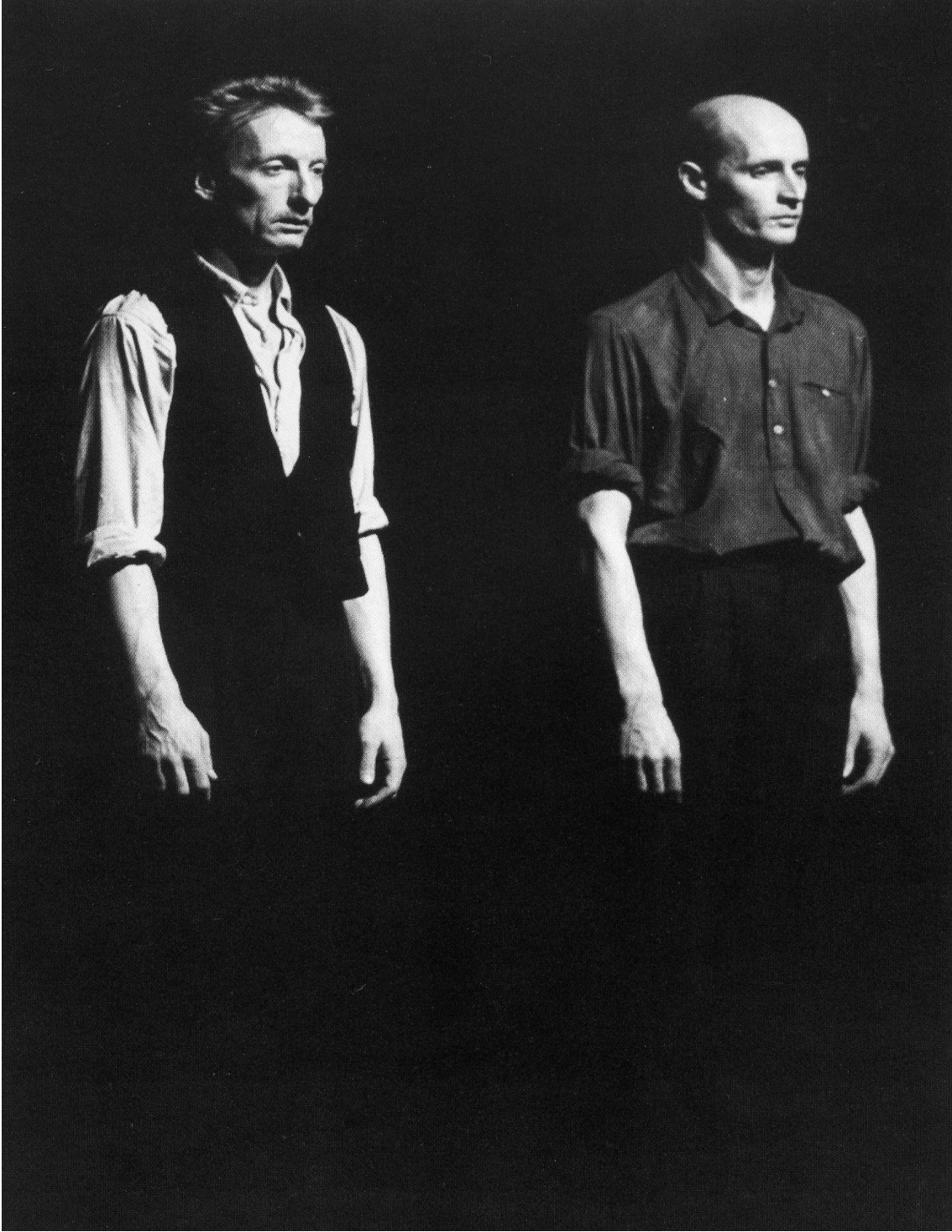
Viktor , Pina Bausch, 1986